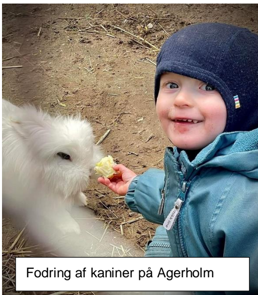
Fodring af kaniner på Agerholm