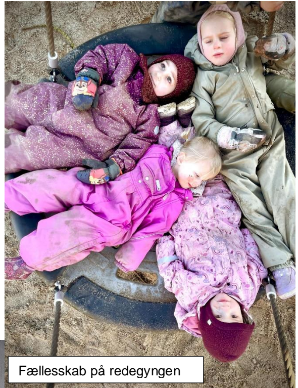
Fællesskab på redegynngen