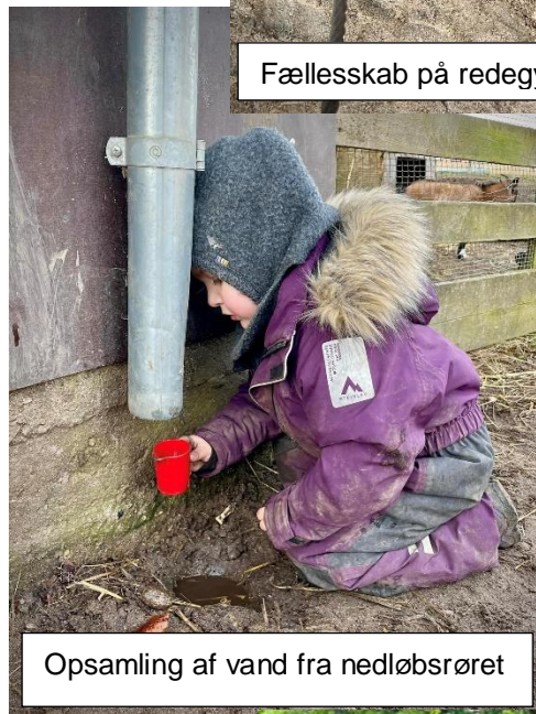
Opsamling af vand fra nedløbsrøret