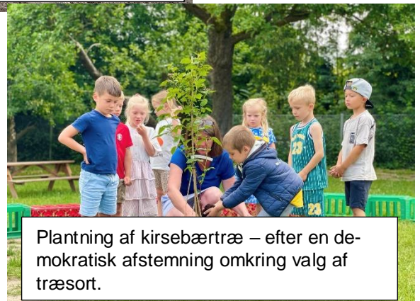
Plantning af kirsebærtræ – efter en demokratisk afstemning omkring valg af træsort.