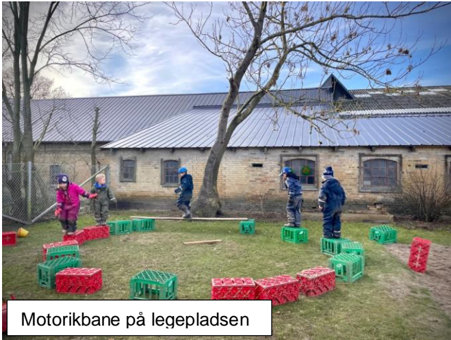
Motorikbane på legepladsen

Læreplanen lever i alt, hvad vi gør igennem hele dagen. De følgende billeder viser hvordan vi dagen igennem indtænker læreplanstemaerne i alt, hvad vi laver