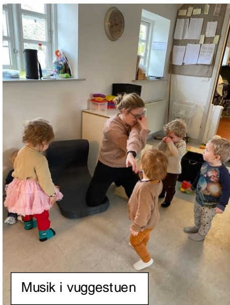
Musik i vuggestuen